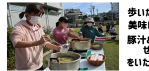
歩いた後は 美味しい 豚汁& ぜんざいを いただきます