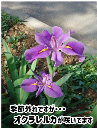
季節外れですが… オクラレルカが咲いています

本島各地から桜や梅の花だよりが届いていますが、10年に1度の強烈な寒波が日本列島に流れ込みここ南国沖縄でも寒の戻りで、春の訪れはあと少し先かな。公民館の桜の木では一輪、二輪とかわいらしい桜の花が咲き始め、つぼみがいまかいまと春の訪れを待っているようです。少し暖かくなったら、ガーベラやインパチェンス、パンジー、オクラレルカ等の季節の花を見に公民館に足を運んでみて下さいね。コロナやインフルエンザ感染などまだまだ心配な季節です。健康に留意しご自愛くださいませ。