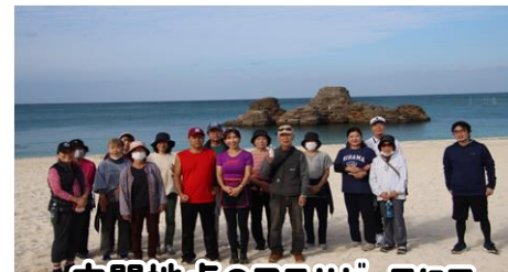
中間地点のアラハビーチにて

当日は、ウォーキングするには暑いくらいの晴天。参加者77名が歩いて歩いてみんなの歩数合計100万歩にチャレンジ！