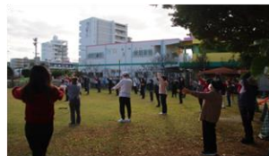
歩く前にしっかりと準備体操！