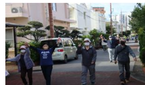
フィニッシュ！！公民館に着いた〜！