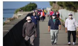
みなさんご自分のペースでウォーキング♪