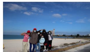
青空の下でハイチーズ！