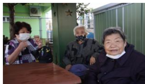
私たちは公民館の広場を歩きます！