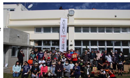
みんなの歩数合計は601,133歩。100万歩には届きませんでしたが、みんなで同じ目標に向かって挑戦でき楽しかったですね(^^)来年こそは100万歩達成しましょう！お疲れ様でした！次回はもっとも多くの区民の参加お待ちしております