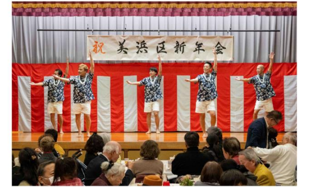
カイルアフラスタジオさんのハワイアンフラ