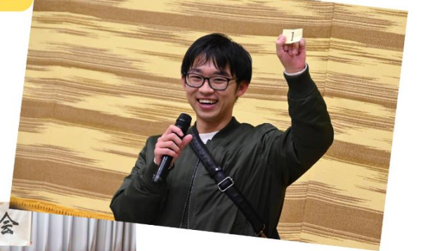
巳年生まれの人集まれ〜！ おめでとうございます