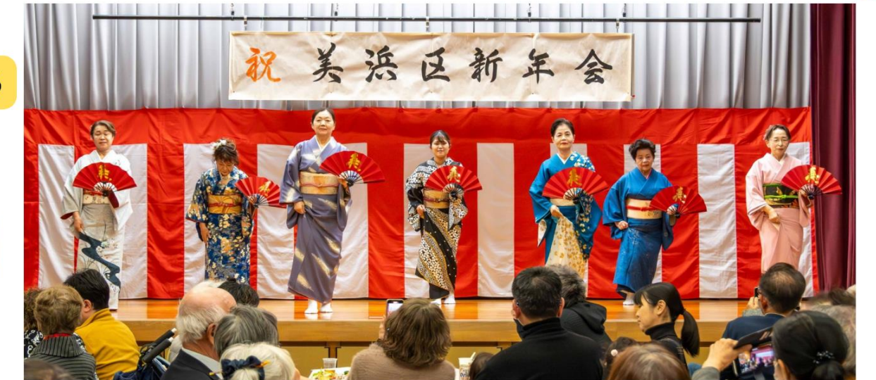
公民館講座受講者による日舞「二輪草」を初披露