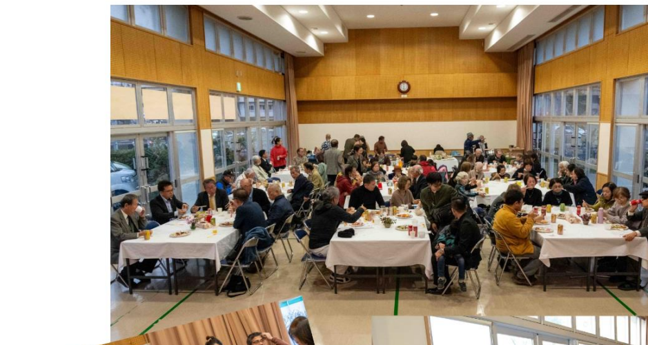
誰に当たるかな？お楽しみ抽選会