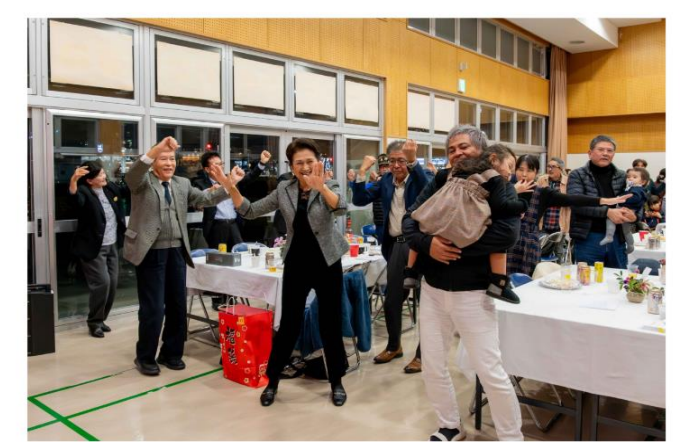
最後は会場みんなでカチャーシーカチャーシー♪