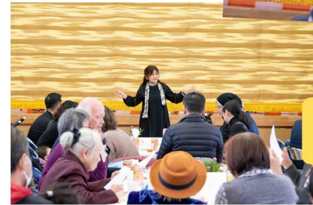
「北谷町の歌」と 「わたした美浜」を みんなで合唱♪